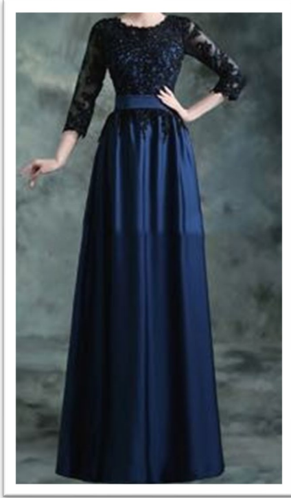
アフタヌーンドレス 昼の正礼装