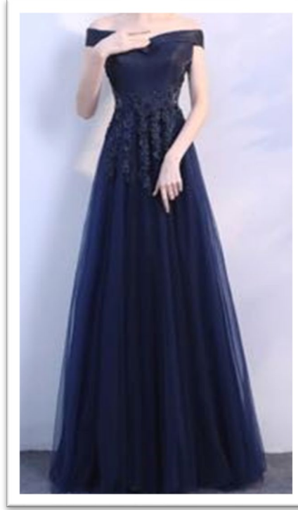
イブニングドレス 夜の正礼装