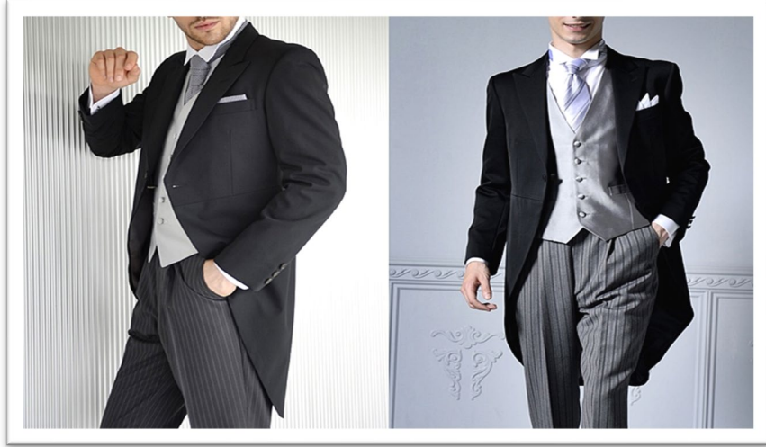
モーニングコート昼の正礼装